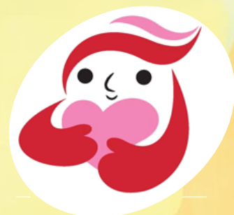
犯罪被害者支援シンボルマーク 「ギョットちゃん」