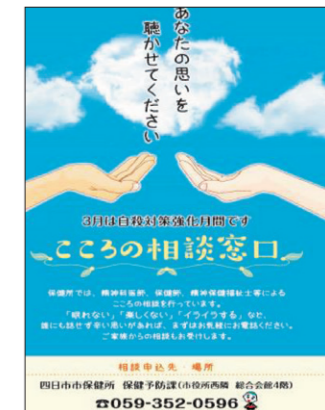
周知・啓発用ポスター