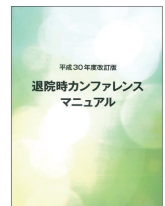
退院時カンファレンスマニュアル