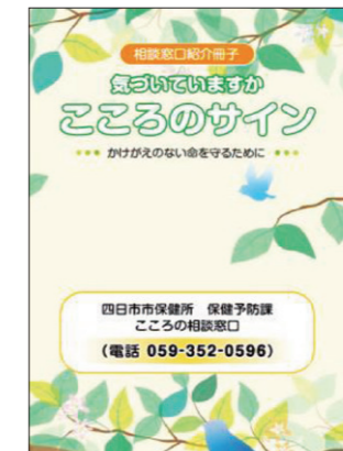
周知・啓発用パンフレット