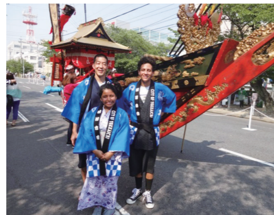
ロングビーチから来訪した交換学生と教師

今後は、これまで培ってきた姉妹都市・友好都市交流をベースに、時代の流れやニーズに即した国際化、グローバル化を図っていく必要があります。