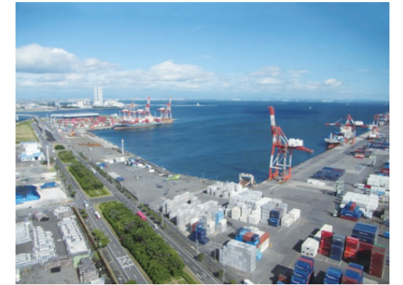
霞ヶ浦地区コンテナターミナルの様子