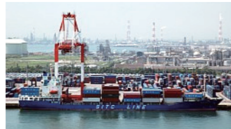
物流需要が増大する霞ヶ浦地区

四日市港における物流需要の約9割を取り扱う霞ヶ浦地区では、バイオマス燃料やオイルコークスなどのエネルギー関連貨物の新たな受け入れや、完成自動車の輸出再開やコンテナ貨物の取扱量の増加により、混雑に拍車がかかっています。