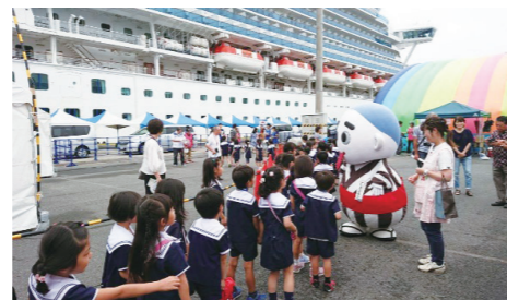
クルーズ船来航時の様子

こうした状況をシティプロモーションや国際交流の機会と捉え、官民一体となって、クルーズ船の受入れを推進してきましたが、とりわけ、四日市港発祥の地である四日市地区では、市街地に近い利点と文化的資源や景観等を生かした憩いの場として、いつでも市民や来訪者が港に立ち寄って楽しめる魅力的な空間づくりを進めるなど、より一層、本市の魅力を高めていく必要があります。