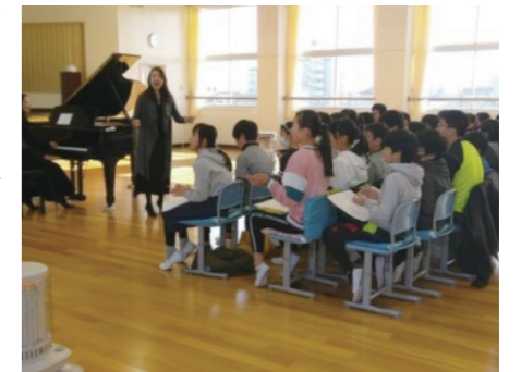
音楽家による学校訪問事業の様子