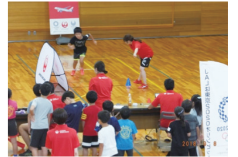
スポーツ能力測定会