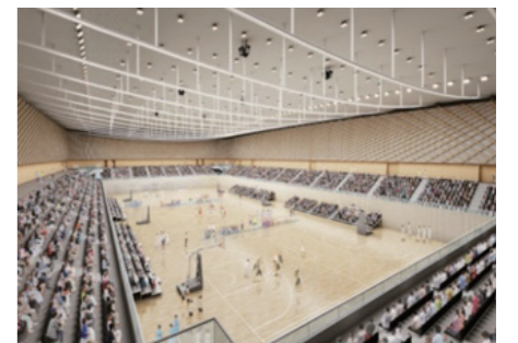
四日市市総合体育館