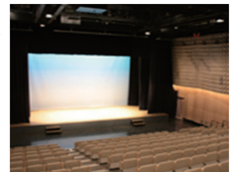
小規模文化ホールの例