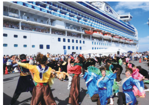
ボランティアによる外国客船のおもてなし