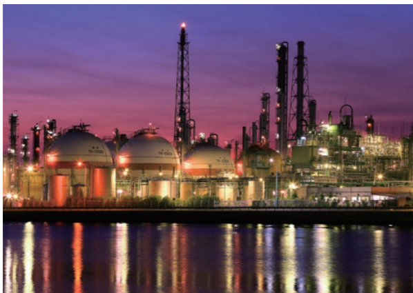
コンビナート夜景

このような潜在的来訪者に対して、本市の情報や魅力の効果的な発信、市民・事業者等のおもてなし意識の醸成を図ることで、来訪者を増やし、新たな交流を生み出す仕組みを創り出す必要があります。