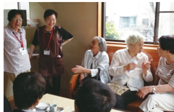
地域が主体となった「交流とたすけあいの拠点」のイメージ