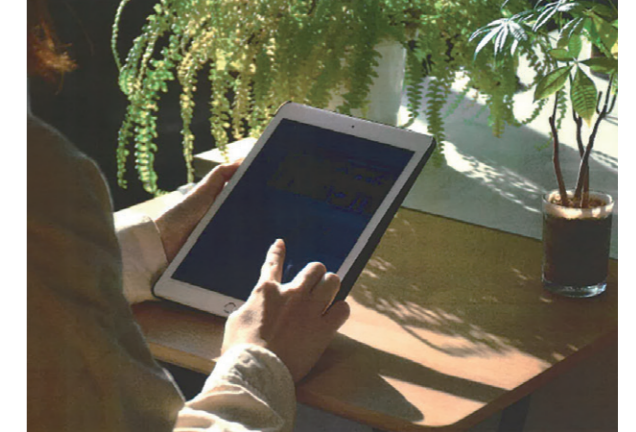
情報発信のイメージ