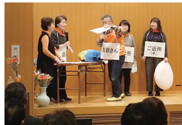
啓発事業に取り組む認知症フレンズ = イベントでの寸劇の様子 =