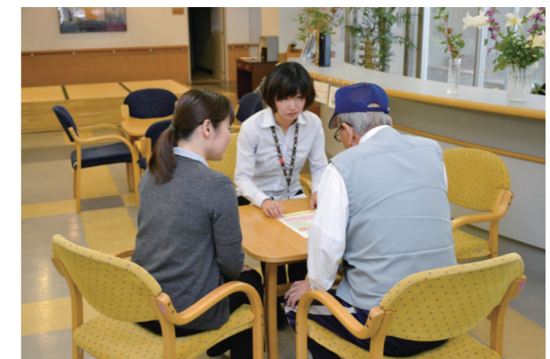
認知症初期集中支援チームが家族からの相談に対応