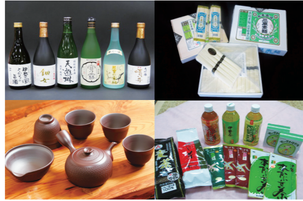
来訪者が“四日市の良さ”をテイクアウトし、帰郷地で拡散してもらうことで、本市を知り、好きになってもらうきっかけとします。