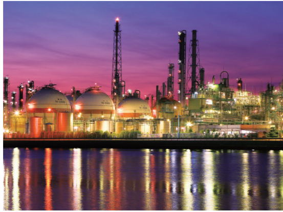
四日市コンビニート夜景