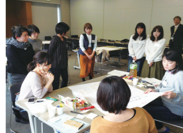
四日市ホンネ女子トーク(平成29年度)