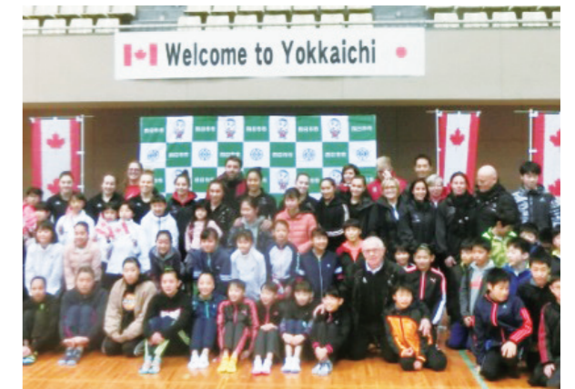
令和2年の東京オリンピックにおいて、事前キャンプを決めたカナダ体操チームとの交流写真