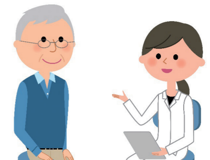
市内運動施設において、体組成計測や体力測定を行う体力測定会をスポーツ推進委員と連携して開催します。