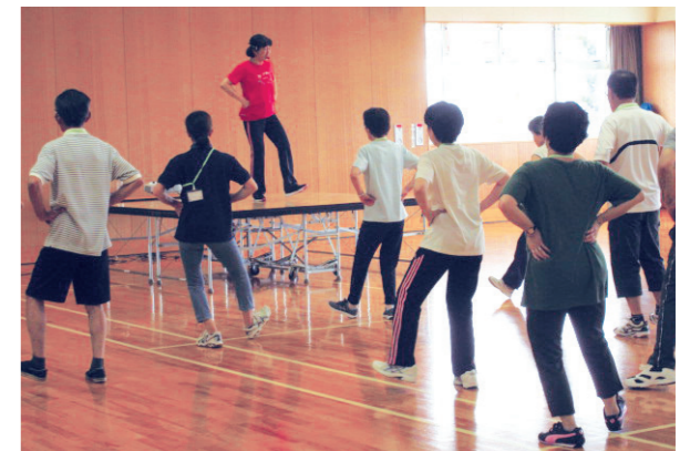
健康づくりに関心をもつきっかけとなるよう、楽しみながら自然に歩くことやからだを動かすことが体験できる健康づくり教室、ウォーキング大会などの多様な事業を実施します。