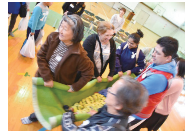
地域活動への外国人市民の参加が進んでいるところでは、大切な地域の担い手となっています。

具体的取組 ① 自治会等と連携し、多文化共生の地域づくりを促進します。 ② 情報通信技術の活用等により、日常生活に必要な情報を多言語で効果的に発信します。 ③ 就労や就学に向けて必要となる日本語学習の機会を提供します。 ④ スポーツや文化イベント等様々な機会を通して異文化への理解を促進します。