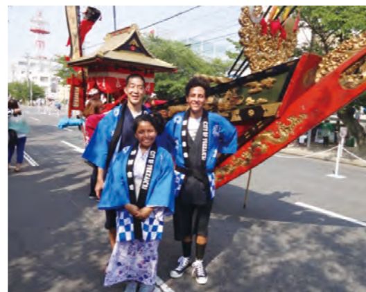
ロングビーチから来訪した交換学生と教師

今後は、これまで培ってきた姉妹都市・友好都市交流をベースに、時代の流れやニーズに即した国際化、グローバル化を図っていく必要があります。