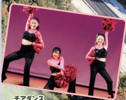
チアダンス Fairy's(フェアリーズ)

フリーウォーキングを楽しんだ後はステージイベントを楽しもう! TOKAI RADIO「1・2・3四日市メガリージョン!! 7」公開収録も開催! ゲスト にお笑い芸人のチャンカワイさんと、アーティストの茉ひるさんのミニライブ も開催! さらにチアダンスや和太鼓演奏などでステージを盛り上げます!