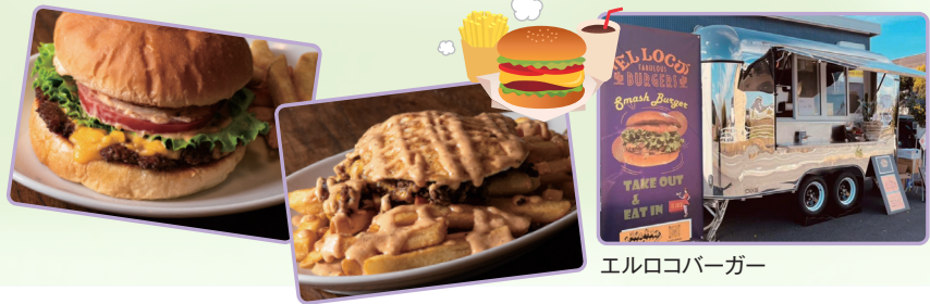
エルロコバーガー

キッチンカーで作る できたての美味しい料理が大集合! 話題の「やきいもらんど」も登場! ウォーキングのあとは、おいしい食事で心もお腹も大満足! 友達や家族みんなで、楽しく美味しい ひとときを過ごそう!