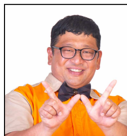
お笑い芸人 チャンカワイさん