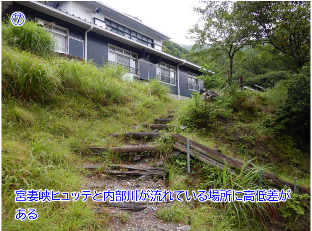
【追記】宮妻峡ヒュッテは令和7年1月時点で解体済