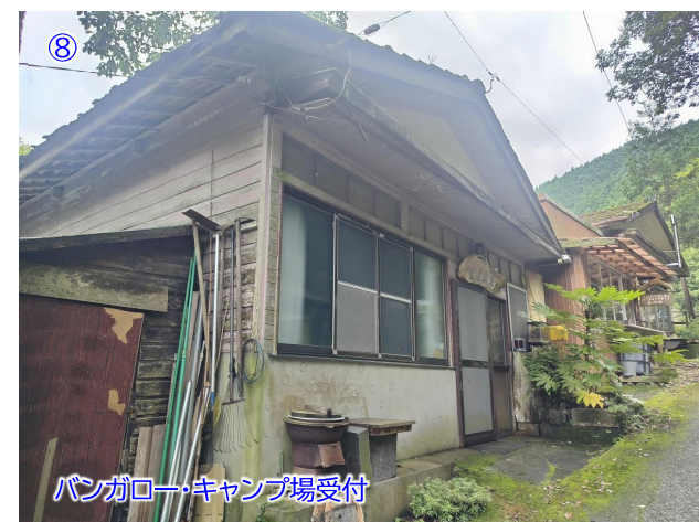
バンガローキャンプ場受付