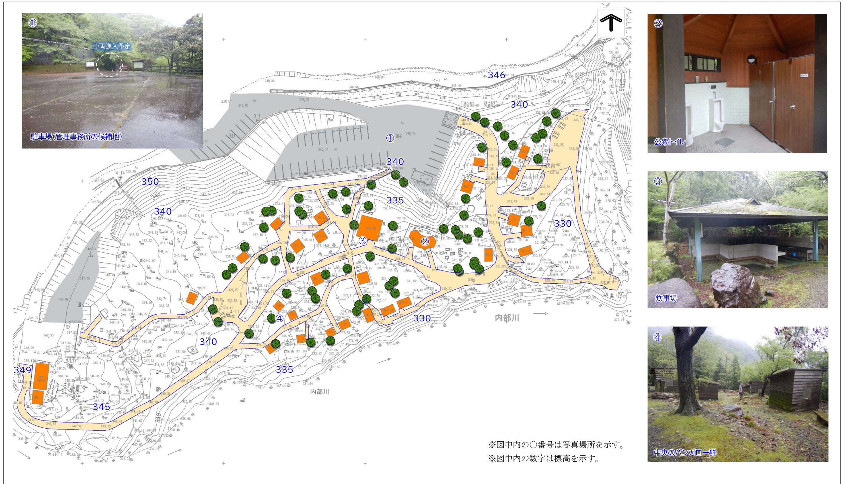
図 主な現況施設 (1)