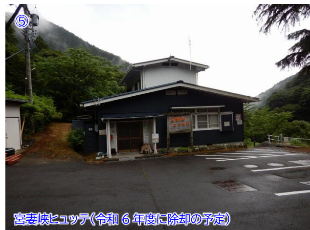
宮妻峽ヒュッテ(令和6年度に除却の予定)