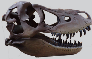
タルボサウルス頭骨 モンゴル 約7500～6500万年前(レプリカ) (一財) 進化生物学研究所

先カンブリア代、古生代、中生代、新生代の化石を通して、太古の世界へタイムスリップします。