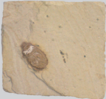
昆虫類(コウチュウ目) ブラジル 約1億年前 (一財) 進化生物学研究所