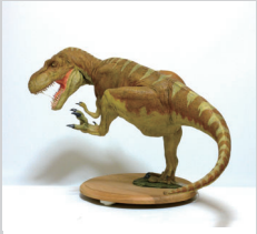
ティラノサウルス (1/20) 荒木一成氏制作

実寸大の恐竜標本で大きさを体感できるほか、さわられる化石の展示も行います。動く恐竜ロボットは迫力満点です。肉食恐竜と植物食恐竜の特徴を比較してどっちが好きか投票を行います。シアターでは3Dメガネをつけて、飛び出す恐竜の映像をご覧ください。