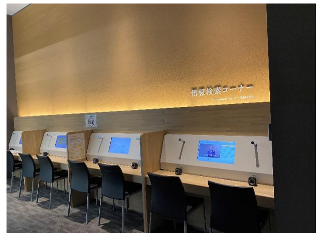
〔情報検索コーナー〕