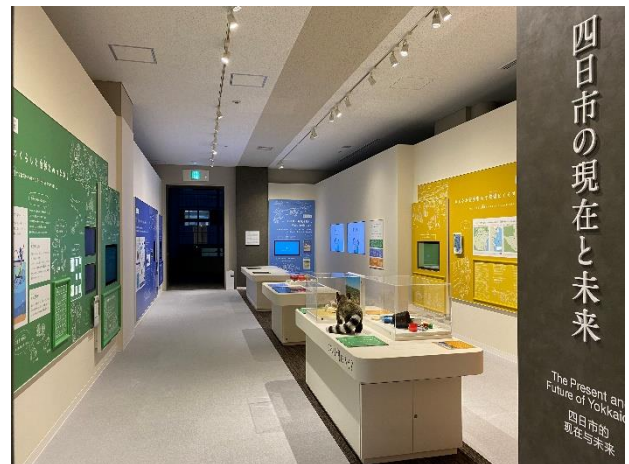
〔四日市の現在と未来〕