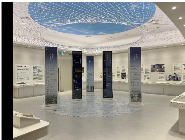
〔環境改善の取り組み〕