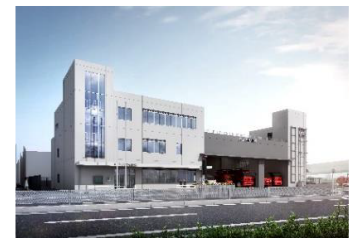
南消防署整備イメージ図

本市の南部臨海地域における消防活動拠点の機能強化を図るため、令和元年度から4カ年事業として進めている南消防署について、改築工事を行います。