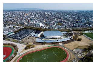
中央緑地と 四日市市総合体育館

開催中止となった三重とこわか国体・三重とこわか大会に向けて培ったレガシー（遺産）を活用し、両大会の中止により喪失したトップレベルの競技を観る機会を設けるため、両大会正式競技・種目の国際大会・全国大会の誘致を図ります。