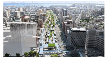
中央通り将来イメージ

近鉄四日市駅・JR四日市駅周辺において、中央通りなども含めた駅前広場などの整備により、中心市街地の活性化や交通機能の向上を図ります。