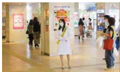
近鉄四日市駅北口での街頭啓発