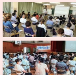
各地で行われる人権啓発活動