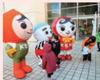
じんけんフェスタ