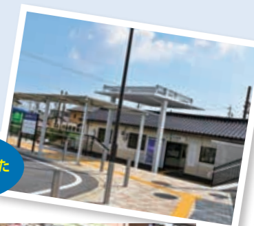
令和3年にリニューアルした内部駅