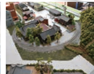
取材時制作中の内部線ジオラマ