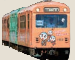
リニューアル前の車両