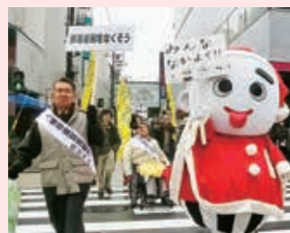
人権尊重都市宣言20周年パレード 人権尊重都市宣言の周知・呼び掛けをしました