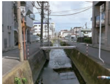
あすなろう四日市駅のホームから見える阿瀬知川。かつては八王子線で運んだ物資を、この川の水運を利用し四日市港まで輸送した物流の要でした

本年、四日市あすなろう鉄道内部線は開業 100 周年、八王子線は開業 110 周年を迎えました。100 年を超える歴史の中で、本市の産業発展を支え、途中、廃線の危機に直面しながらもそれを乗り越えて存続してきた四日市あすなろう鉄道。現在は市民の通勤や通学をはじめ、生活を支える公共交通としての役割を果たしています。そんな四日市あすなろう鉄道の魅力と、沿線地域の文化財・見どころを紹介します。 そして、今年日本で鉄道が開業して 150 周年。本市を走る身近な鉄道に乗って、沿線散策と歴史の痕跡を探る旅に出掛けてみませんか。