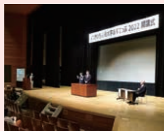
よっかいち人権大学あすてっぷ