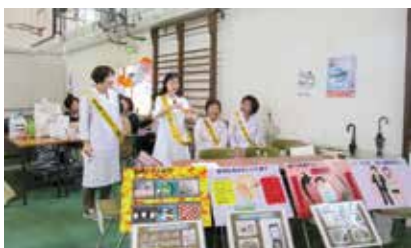
薬物乱用防止キャンペーン

地域の身近な保健・医療の専門家として、医薬品の調剤供給を通して、地域に寄り添った業務を心掛けています。また、学校薬剤師として、学校環境の維持改善のため、教室の騒音や空気環境の環境検査、飲料水やプールの水質検査などもしています。最近では、新型コロナウイルスワクチンの集団接種でも、お手伝いをさせていただきました。