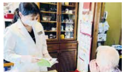
訪問薬剤管理指導