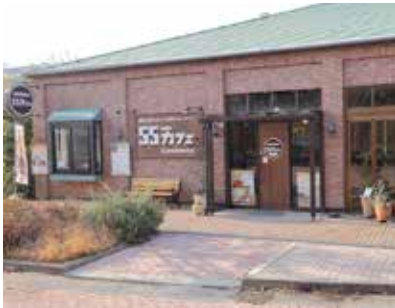
イオンモール四日市北 レンガ棟前にあります！

NPO法人三重はぐくみサポートでは、四日市市の委託を受け、コロナ禍という不安定な社会情勢の中で、孤独・孤立で不安を抱える女性に対して、相談窓口の設置や居場所の提供、生理用品の提供を行います。