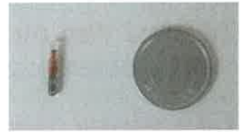
直径1.2mm、長さ8mm程度の円筒形の電子標識器具です。

この個体識別番号をあらかじめ「犬と猫のマイクロチップ情報登録」サイトに登録しておくことで、迷子になって保護されたときなどに、飼い主に連絡することができます。