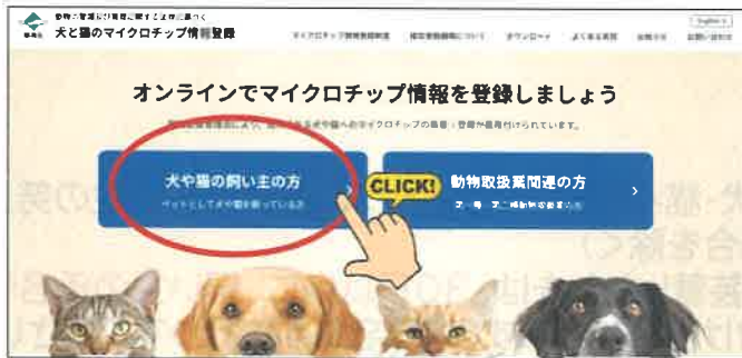
犬と猫のマイクロチップ情報登録サイト トップページ