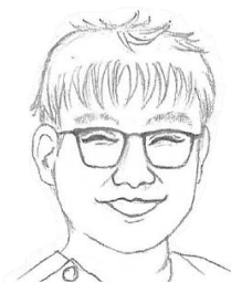
Giáo sư Hiroshi Ueno (bác sỹ nha khoa học đường)

Khi đeo khẩu trang các em có để miệng luôn mở không. Hãy luôn nhai kỹ đồ ăn và uống nhiều chất lỏng. Và hãy luôn thở bằng mũi nhé.