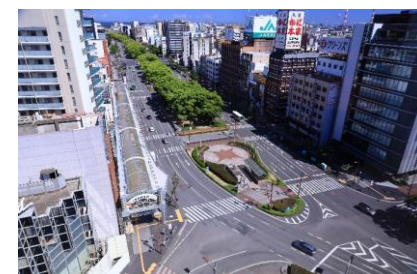
近鉄四日市駅前(中央通り)の状況