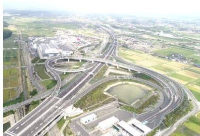
東海環状自動車道東員IC