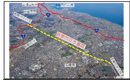
国道23号鈴鹿四日市道路 （鈴鹿市上空から四日市港方面）