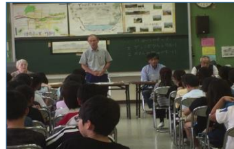
小学校4年生の総合学習授業風景