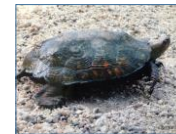
亀もあちこちに出没