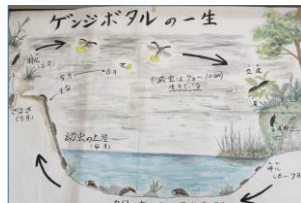
ゲンジホタルの一生について