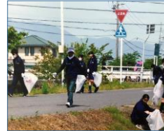
大池中学校の土曜活動で参加した生徒達とごみ拾いの実施