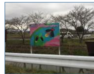
「ようこそホタルと桜のまちへ」 (竹谷川に設置された 小学生最優秀作品)