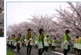
桜まつりに披露されたあがた音頭