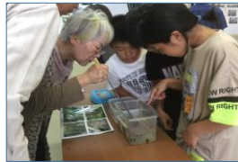
女性会員さんとカワニナを見る児童たち