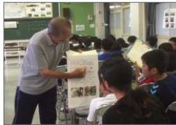
ホタルの説明を熱心に聴く児童たち