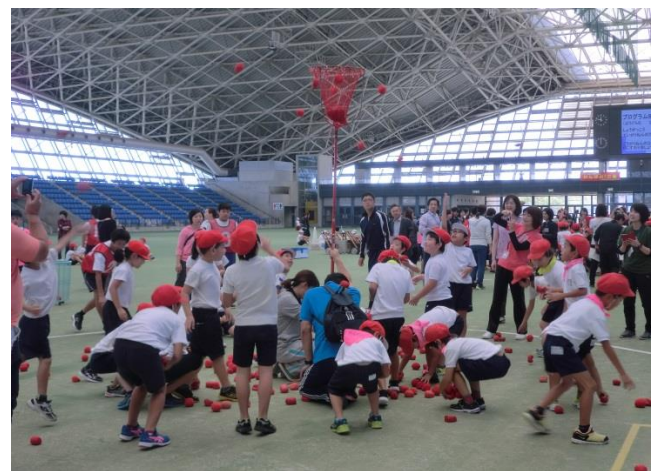
<平成30年度 三泗特別支援学級連合運動会>