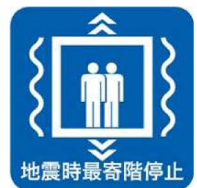
地震時管制運転装置設置済みマーク

本制度に関する詳細については、以下にお問合せください。 一般社団法人建築性能基準推進協会 電話：03-3513-7561 WEB： http://www.seinokyo.jp/