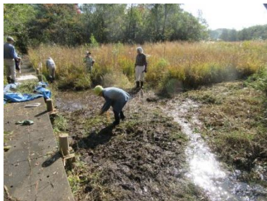
昨年11月16日 除草活動の様子

おかげ様で、両保全区域とも今年もたくさんのシラタマホシクサが見られています。今年は、全体的にシラタマホシクサがまだ枯れていないので、もう少し後の活動で、種採取や種まきを行いたいと思っています。