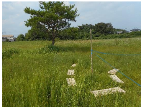
【東部指定地 新たな足場設置】