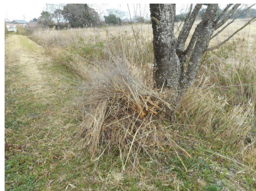
【一旦観察路に除去したハンノキ】