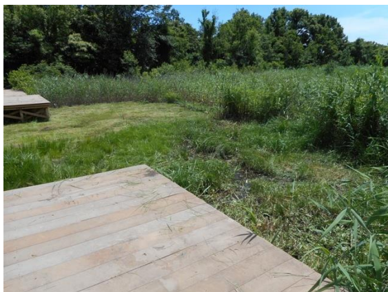
【6月17日の活動後の写真】

一方で、サワシロギクが見頃を迎えつつあります。6月17日に中央観察橋付近のヨシの刈り取り作業をしました。その際、東側観察橋南側については、サギソウも多くないので全面的に刈り取りました。8月22日に観察をしたところ、写真では見づらいですが、そこでもサワシロギクのつぼみがあり、今後多数見られることを期待しています。