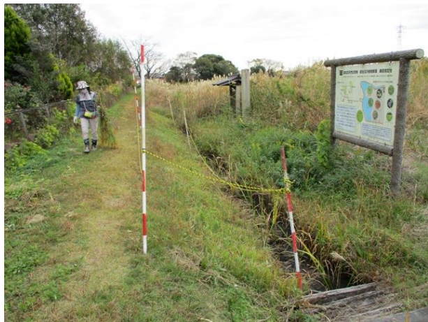
【令和2年11月25日の様子】

これからも様々な準備等をしていきたいと思っておりますので、ご協力をお願いいたします。