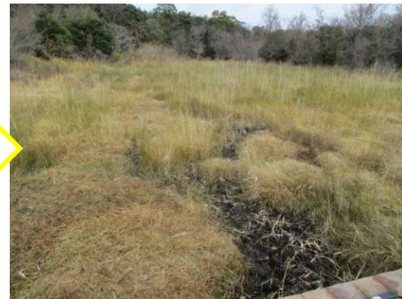
【1月13日の作業の様子】

活動に参加いただいた皆様のおかげで、除草し、きれいに集草も行えました。両区域とも、2月7日（日）の作業箇所に含まれるため、ヤチヤナギ等貴重な植物が誤って刈り取られることの無いようトラロープで囲いをしました。