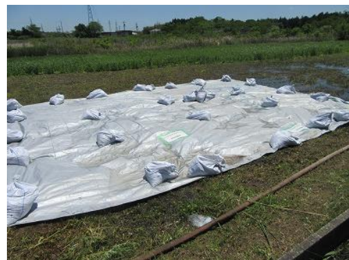
【シートを張った状況】

今年は、刈り取りに加えて、シートを張って日光を遮断し、抑制効果のみをみます。この範囲は、セイタカアワダチソウとヨシがほとんどなので、セイタカアワダチソウだけではなく、ヨシへの効果も見ていきましょう。