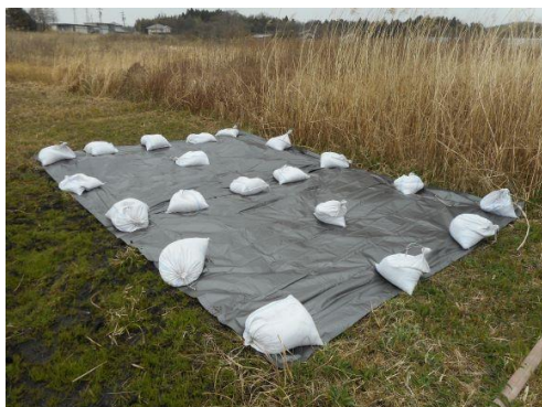
【例年行っている場所で抑制実験】