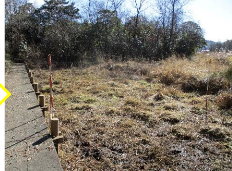
【1月9日の作業の様子】