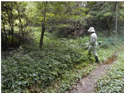
【西部指定地 水源林下草刈り】

さて、そのような天候の中、まさに梅雨の晴れ間となった7月15、16日、そして20日に、西部指定地ではタケ伐採や水源林下草刈り、そして東部指定地では水路沿いや松の木周辺までの除草、食虫植物観察用の足場づくりを行いました。