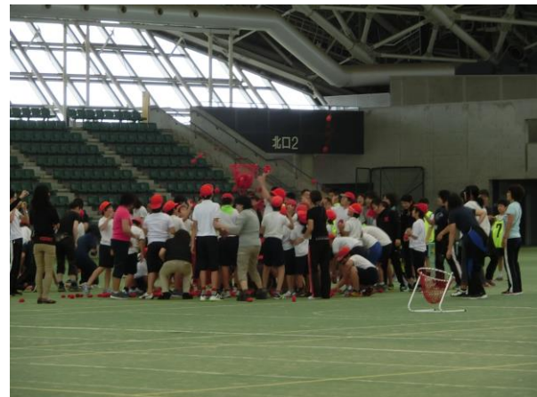
<平成28年度 三泗特別支援学級連合運動会>