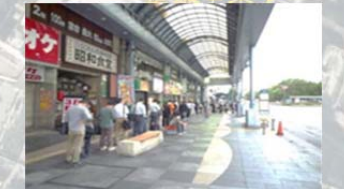
・バス待ち行列による歩行空間の阻害