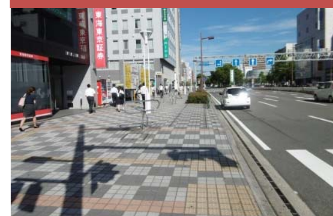
⑪ 中央通り南側、西方向への動線