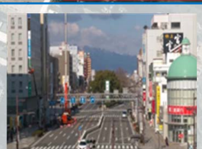
近鉄四日市駅ホームから西側の眺望