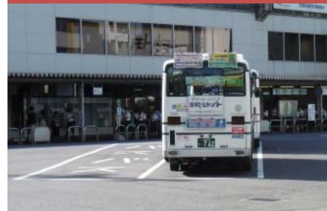
⑮ 西駅前広場のバス待ち状況