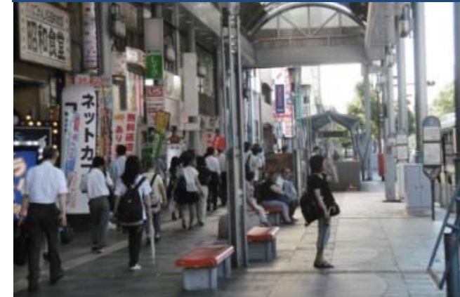
③ 中央通り沿道商店街