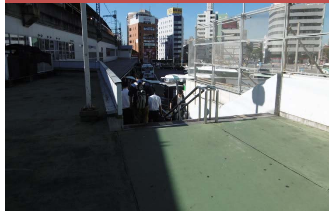
⑭ 近鉄Pから西駅前広場への動線（バリアフリー未対応）