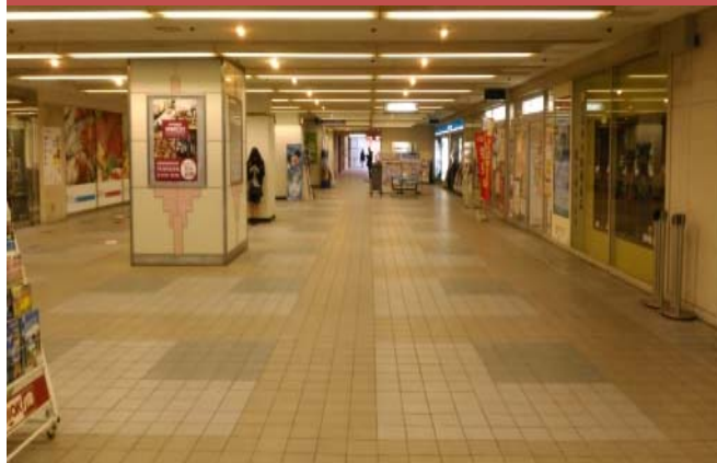
⑬ 西駅前広場と東北駅前広場を繋ぐ東西通路