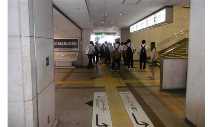
④ 東南駅前広場方面に向かう歩行者動線（東口）