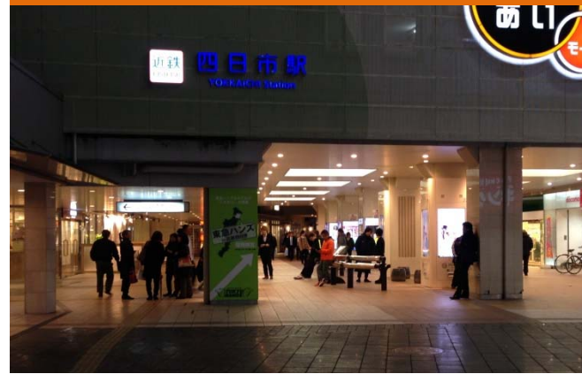
⑥ ふれあいモールにおける待ち合い状況