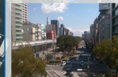
近鉄四日市駅ホームから東側の眺望