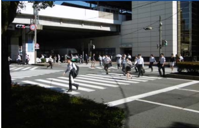
① 東口駅前交差点の横断