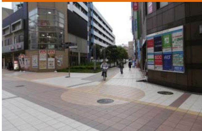
⑨ ふれあいモールから駅西への動線