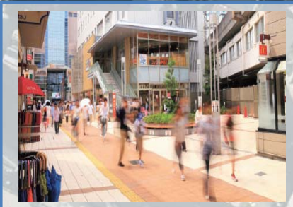
H22~H26 ふれあいモール再整備