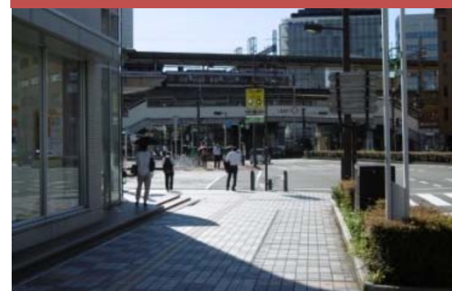
⑩ 中央通り北側の駅西へ向かう動線