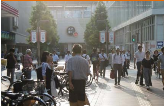
⑤ ふれあいモールにおける動線（駅東側）