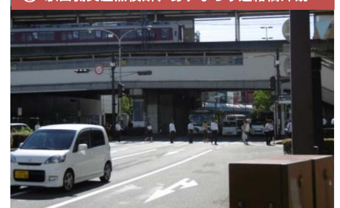
⑫ 駅西側交差点横断、あすなろう連絡橋外観