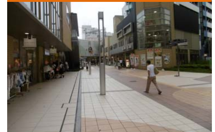
⑧ ふれあいモールにおける動線（駅西側）