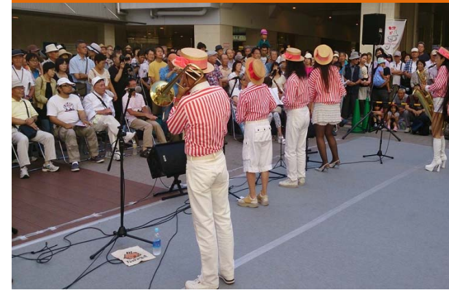
⑦ ふれあいモールにおけるjazzフェスティバルの状況