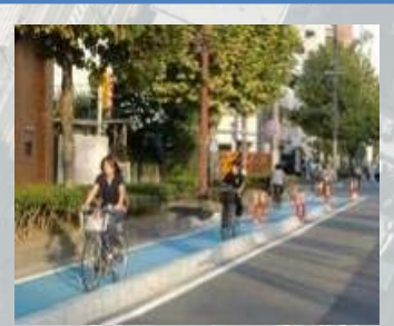
自転車走行レーンの整備(中央通り：市民公園以西で整備済)