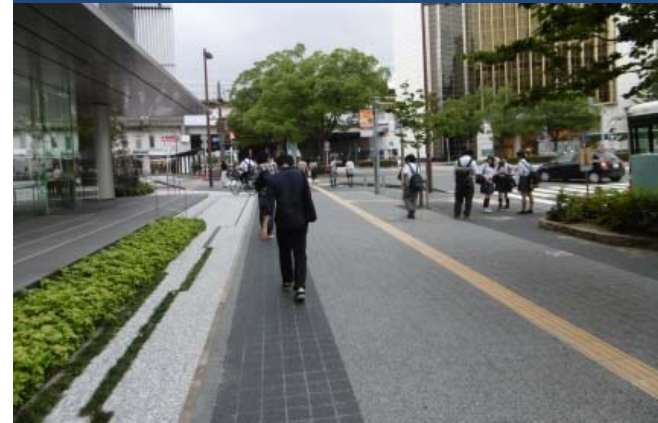
② 中央通りから駅東口へ向かう動線