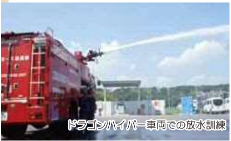
ドラゴンハイパー車両での放水訓練

豊田：たくさん外で遊んでください。元気に体を動かして、もし消防士になりたい子が出てきたらいいですね。たのしみに待っています。