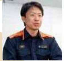
防災活動について語る豊田消防隊員