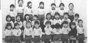
もりのくにコンサート☆☆