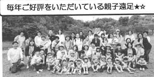
毎年大好評をいただいている親子遠足☆☆