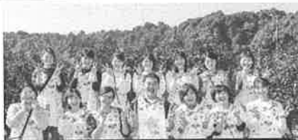
もりのくにファミリー総勢 21 名☆☆