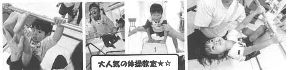
大人気の体操教室☆☆

※慣らし保育期間は設けていませんので、入園時から通常通りの保育をさせていただきます。