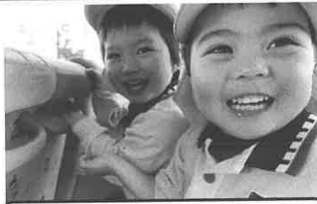
毎日弾ける! とびっきりの笑顔☆☆