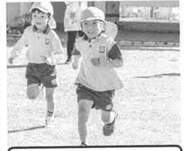
元気いっぱいの運動会☆☆