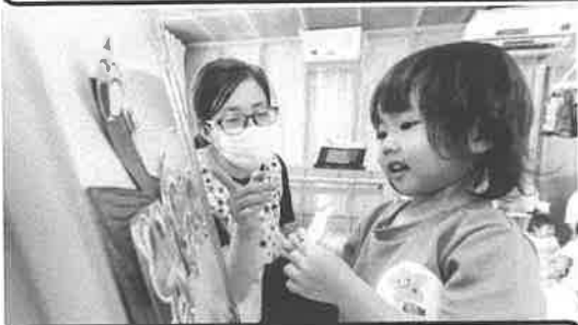
毎朝元気いっぱいの English Time☆☆