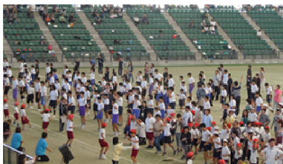
<平成26年度 三泗特別支援学級連合運動会>