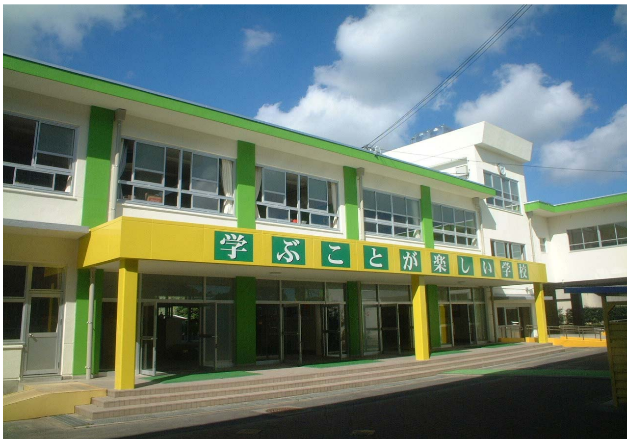
神前小学校 校舎棟