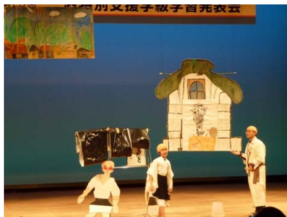
<平成23年度 三河特別支援学級学習発表会>