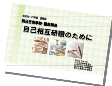
図1 四日市市学校・園教職員 自己相互研鑽のために

「教職員向上サポートブック」を活用するための評価資料である「四日市市学校・園教職員 自己相互研鑽のために」を改訂しました（図1）。これによって、全職種の教職員が自己分析をもとに目標を設定し、自己研鑽を行います。