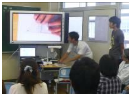
図4 ICT出前研修（後期）模擬授業の交流会

ICT研修では、前年度に引き続き、市内全小中学校対象に出前講座形式の研修（図4）を実施しました。平成22年度前期は、ICT機器活用研修を行いました。また、後期は、ICTを授業でどのように活用するかをテーマに、教材研究と模擬授業を中心としたワークショップ型の研修形態を取り、教職員のICT活用指導力の向上を図りました。