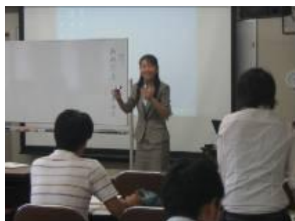
図2 若手教員対象の研修会

その結果、若手教員同士の交流研修（図2）や、ミドルリーダー教員研修（図3）など、ライフステージに応じた研修講座、自己の課題に見合った研修講座の受講が増えました。