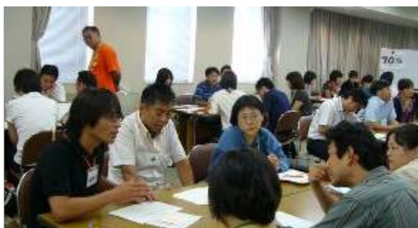
図3 ミドルリーダー教員対象の研修会