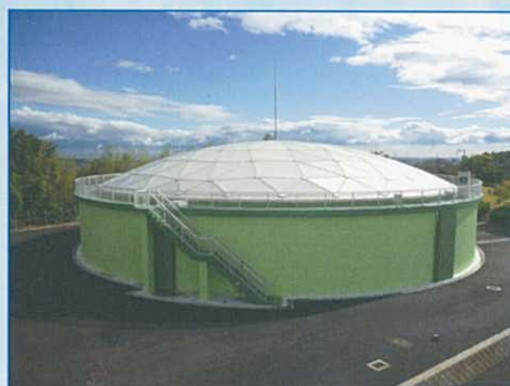
【配水池（緊急遮断弁付）】 災害時には飲料水を供給する設備があります。