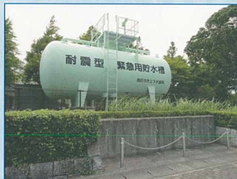
【緊急用貯水槽（地上式）】 こちらは、地上式の緊急用貯水槽です。

四日市市上下水道局では、地震などの災害により水道が出なくなった場合に備えて、市民のみみなさんに飲料水を供給する『緊急用貯水槽』などの施設を整備しています。もしもの時のために、前もってお近くの応急給水拠点を確認しておきましょう！