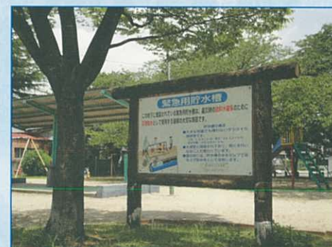
【緊急用貯水槽（地下式）】 この看板の地下に緊急用貯水槽があります。