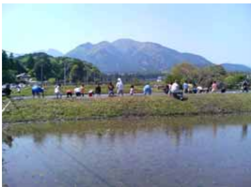
耕作を通じた世代間交流 伝統文化・伝統農法を守る会 水沢

3. 予算額 15,863 千円 (財源内訳) その他特財 100 千円 (前年度 19,134 千円) 一般財源 15,763 千円