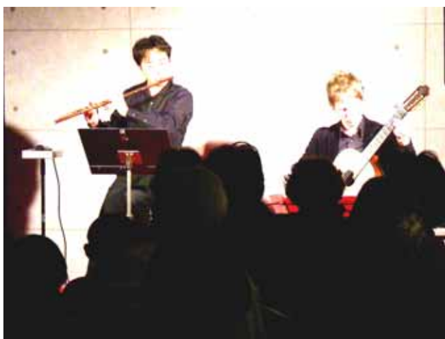
メインステーション・コンサート「商店街でアートに触れる」

3. 予算額 10,382 千円 (財源内訳) 一般財源 10,382 千円 (前年度 0 千円)