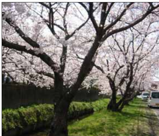
楠地区宝町内の桜並木と水路

3. 予算額 25,000千円(財源内訳)一般財源 25,000千円 (前年度 0千円)