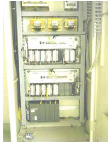
図 2. 中央監視装置(リモートユニット)