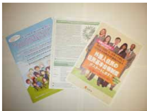
(周知用リーフレット)

3. 予算額 106,496千円 (財源内訳) その他特財 624千円 (前年度 193,710千円) 一般財源 105,872千円