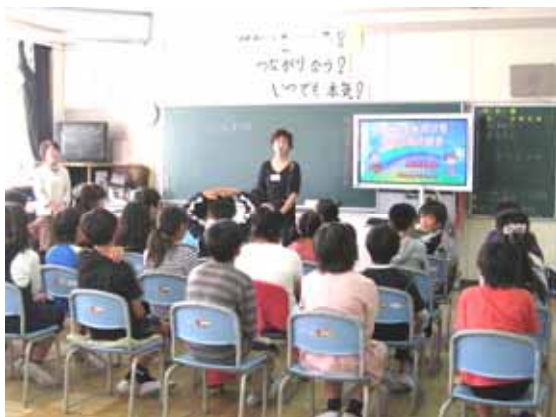
デートDV予防教育(小学校)

予算額 1,900千円 (財源内訳) 一般財源 1,900千円 (前年度) 1,900千円)