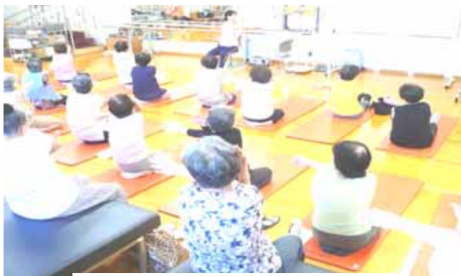
お達者クラブの運動風景