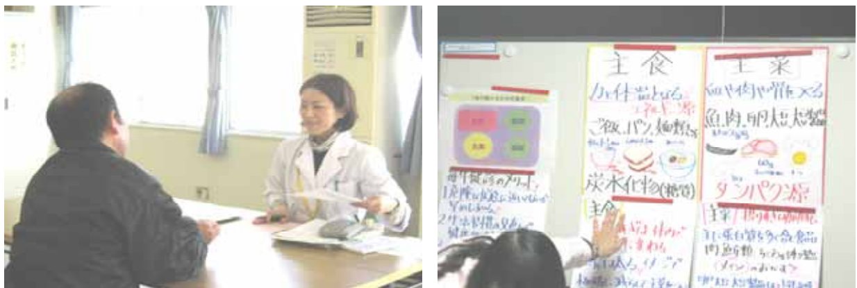
特定保健指導の面談及び栄養指導