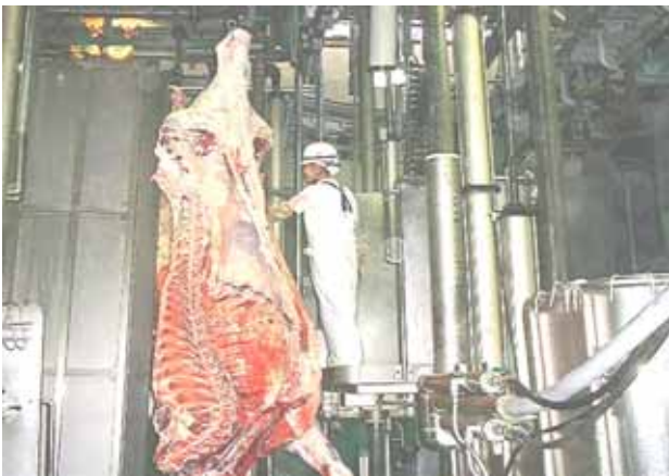
と畜検査（牛枝肉検査）