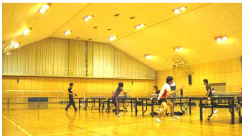
あさけプラザ体育館

3. 予算額 114,241千円 (財源内訳)一般財源 114,241千円 (前年度 12,000千円)