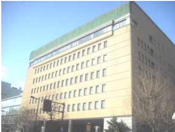
図 1. 総合会館外観

3. 予算額 27,000千円 (財源内訳) 一般財源 27,000千円 (前年度 157,722千円)