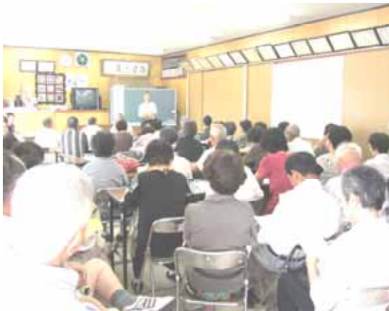
市民による在宅医療啓発活動事業

3. 予算額 14,995千円 (財源内訳) その他特財 279千円 (前年度 9,600千円) 一般財源 14,716千円