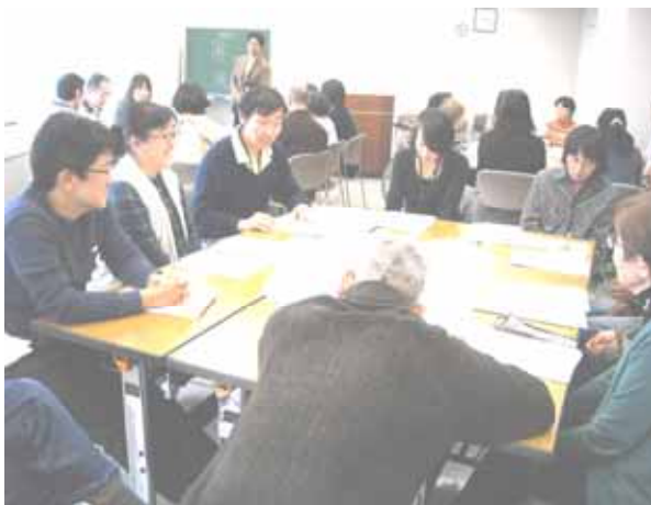
こころの健康講座継続研修

3. 予算額 2,597千円 (財源内訳) 県支出金 1,177千円 (前年度 2,650千円) 一般財源 1,420千円