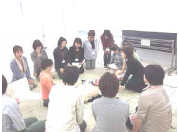
訪問看護師養成講座学内実習