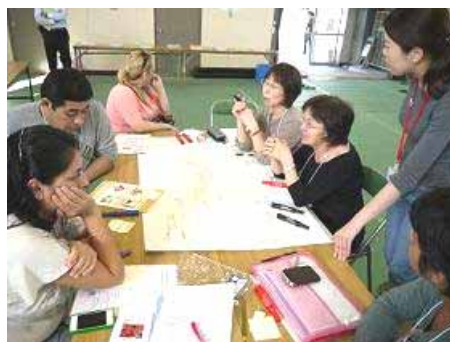
「外国人市民向け防災セミナー」

外国人が集住する笹川地区において、地域活動の担い手となる外国人人材育成や交流事業等を行い、外国人の地域活動への参加促進を図ることにより、日本人住民と外国人住民の「顔の見える関係づくり」に取り組む。また、大規模災害発生時における「共助」の観点から、外国人も地域住民の一員として地域で救助・避難支援活動に参画することができるよう、外国人市民向け防災セミナーを実施する。