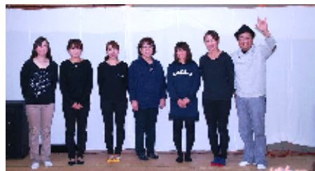
しゅわきょうしつ みな 手話教室の皆さん

ごご だいにしゅうかいじょ しゅわ ぶよう みつ きょうしつかつどう しょうがっこう ちゅうがっこう 午後には、第二集会所で手話、カラオケ、舞踊の三つの教室活動と小学校と中学校 じんけんがくしゅう じんぶんきょう はっぴよう おこな かんきやく まえ ひ せいか ひろう の人権学習(人文協)の発表が行われ、たくさんの観客の前で、日ごろの成果を披露 してくれました。