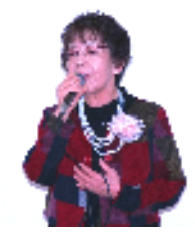
ぶようきょうしつ みな 舞踊教室の皆さん