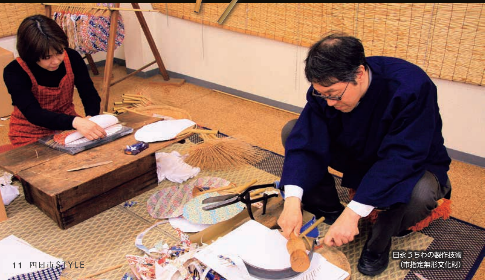
日永うちわの製作技術 (市指定無形文化財)